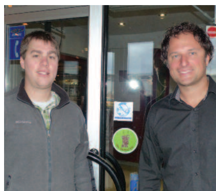
La Rôtisserie St-Hubert fait partie des ICI qui participent... Bravo!

Dans ce même programme, notre usine de purification d'eau potable a atteint la phase 3 d'optimisation, une étape que seules 5 autres villes québécoises ont également atteinte. Les deux distinctions ont été remises à la Ville en même temps en novembre dernier.